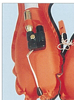
自動膨脹(手動)カット装置