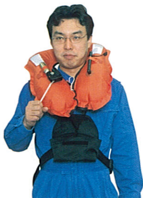
首に掛け手動膨脹させた状態