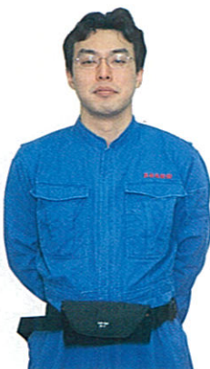
腰に装着した状態

雨や水しぶき等で極度に濡れたままで保管する事はやめて下さい。自動膨脹感知スプールは高湿度状態が継続した状態でも感知作動・膨脹する事が有ります。