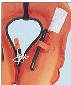
口による充気装置と笛